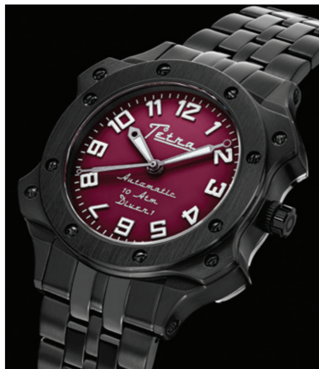
Il Diver 1 con finitura Dlc nera, in vendita a 570 euro.

stilizzato che, a prima vista, potrebbe ricordare una ruota dello scappamento.