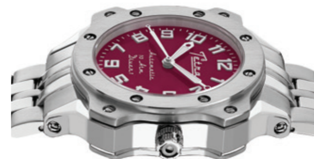
Cassa a sandwich con finitura lucida e satinata per il Diver 1. In vendita a 520 euro.