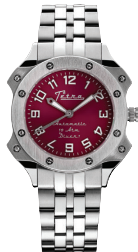
Il modello Diver 1 si può personalizzare con quadrante, lancette e indici di vari colori ed è fornito con un cinturino supplementare in pelle.