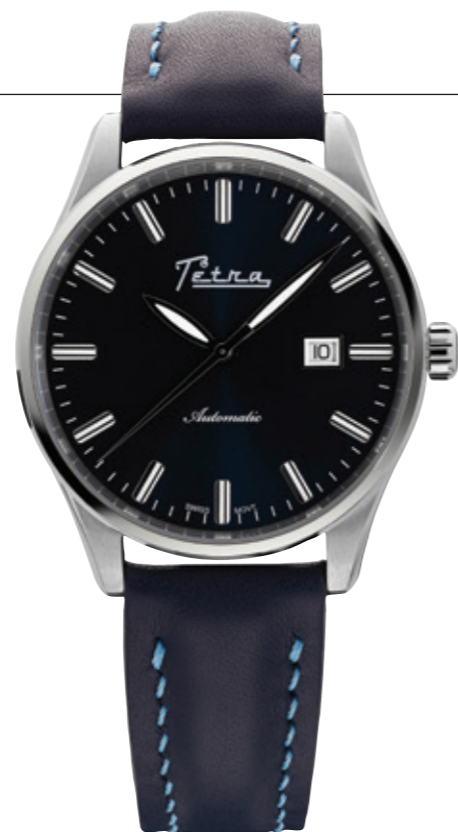
Il modello Elegance da 42 mm con quadrante e cinturino blu.

Il Diver 1 di Tetra Project è un mix equilibrato di elementi familiari e novità. La cassa a "sandwich" da 40 mm di diametro ha quattro spallette che le danno un aspetto robusto, mentre le viti sulla ghiera sono un richiamo agli orologi con bracciale integrato degli anni '70 (quelli di un signore chiamato Gérald Genta...), ma l'impostazione generale risulta originale e di impatto. Il bracciale in acciaio riprende l'alternanza tra finitura lucida e satinata della cassa e la resistenza alla pressione è di 10 atmosfere. Molto originali anche le lancette che terminano con un puntatore circolare e il font scelto per le scritte sul quadrante. Il movimento meccanico a carica automatica Miyota 8215 è un affidabile "muletto" da 21.600 alternanze/ora, con 21 rubini e 40 ore di riserva di carica. Sul fondello, anch'esso serrato da otto viti, è inciso il nome del brand e un disegno