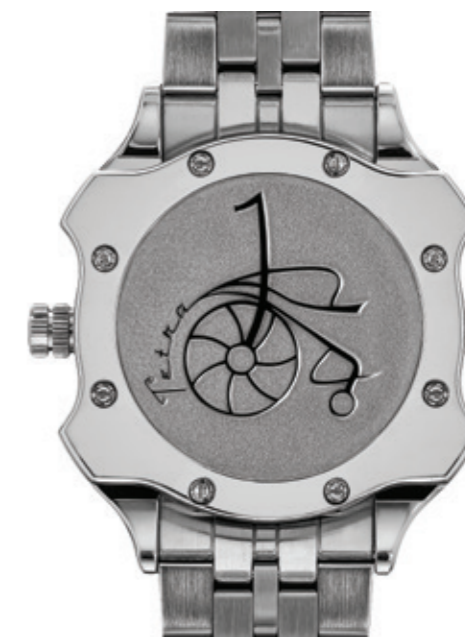
Il fondello del Diver 1 serrato da otto viti col logo della carrozzella stilizzata.